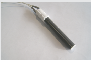
keramički grejač, omogućuje brzo i sigurno potpaljivanje peleta