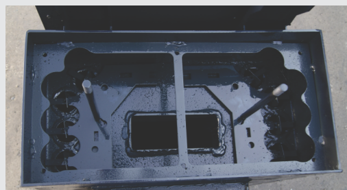
cevni izmenjivač sa mehanizmom za čišćenje