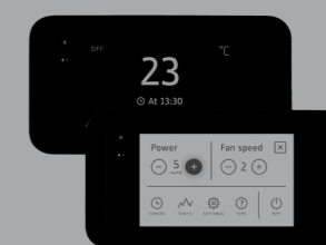
multifunkcionalna digitalna regulacija rada kotla sa ekranom osetljivim na dodir