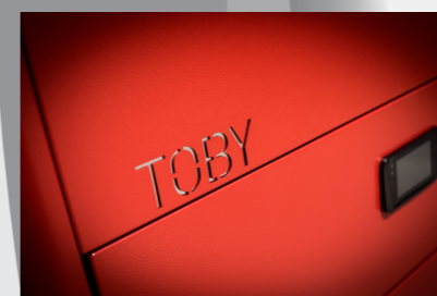
savremen dizajn daje moderan izgled kotla